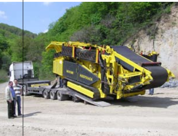
■ Jednostavan istovar