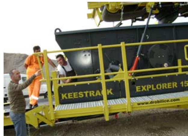
■ Obuka ljudi